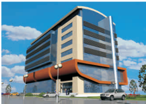
Noul sediu al SNSPA